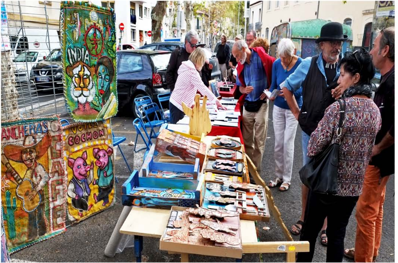
Salon des livres et des arts de Figuerolles 17 septembre 2014