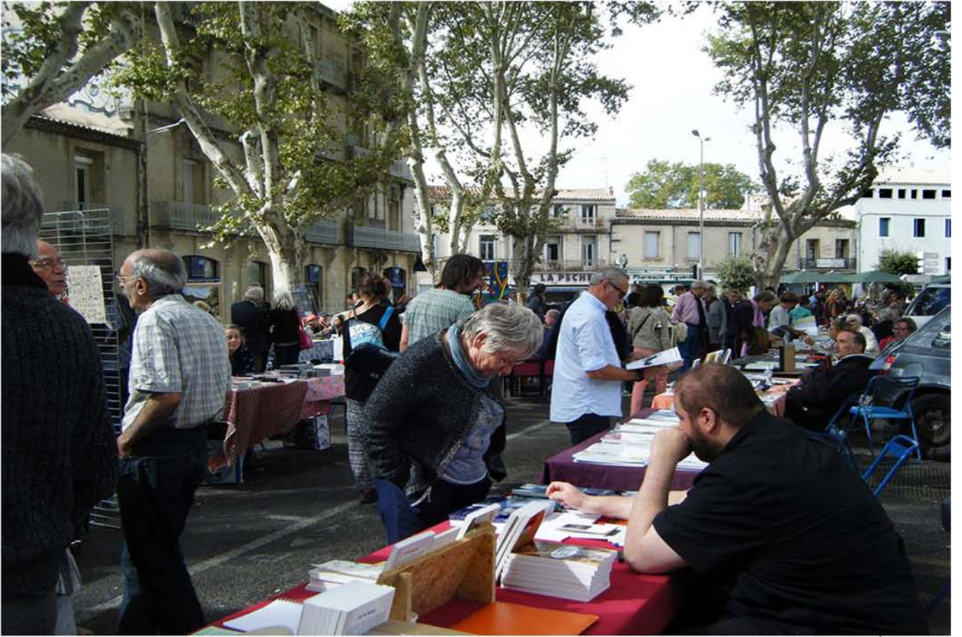
Salon des livres et des arts de Fiqueroles 17 septembre 2014