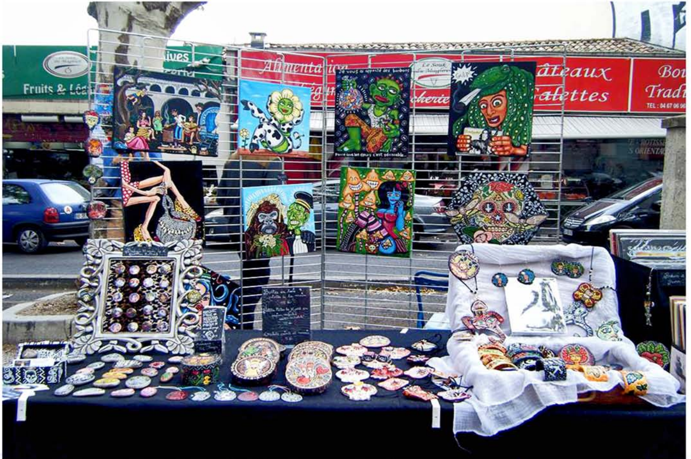
Salon des livres et des arts de Figuerolles 17 septembre 2014